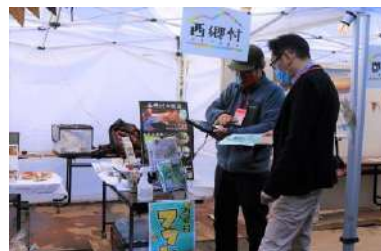
⑤フットパスウォークの紹介