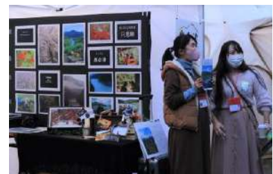
⑦活動写真の展示、奥会津の魅力発信