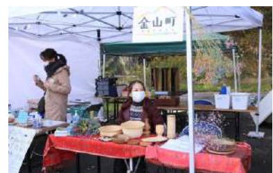
⑭マタタビ細工・カスミソウの展示