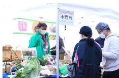
⑩協力隊が生産している野菜の販売