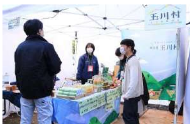
⑨さるなしを使った商品の販売