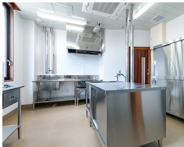
「かんかてらす」のキッチンスペース （この他、菓子製造室も備えられています）