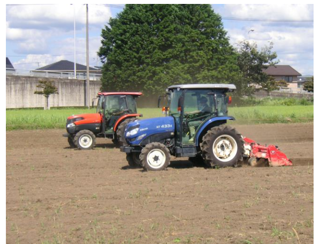
播種前の機械による耕運の様子 （町で機械も所有しています）