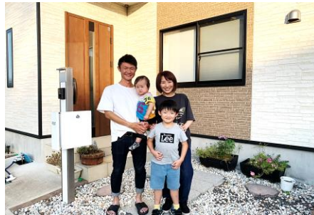
若者世帯が移住・定住