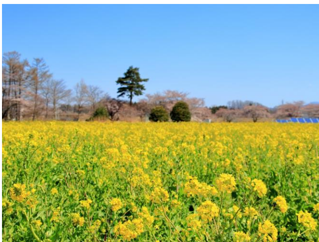
かがみいし油田計画「菜の花畑」！ （町内数か所、約10haで栽培）