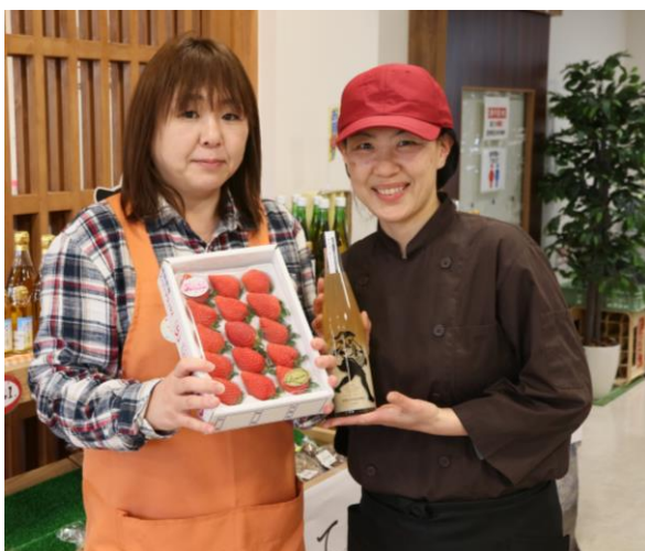
町の特産品の販売を行っています！ （まちの駅「かんかてらす」）