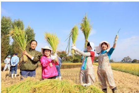
町民手作りの田んぼアート！