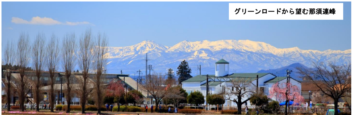
グリーンロードから望む那須連峰

第20回国勢調査（平成27年）の確定値では、15歳未満の人口の割合が県内で一番高い結果が出ました。町の中央に位置するJR鏡石駅の半径1.5 km県内に人口の7割以上が居住していることから駅を中心とした「コンパクトで住みやすく、若い世代の多いまち」です。