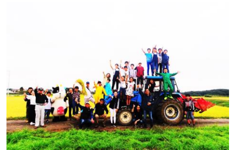
キッズタウンかがみいし！